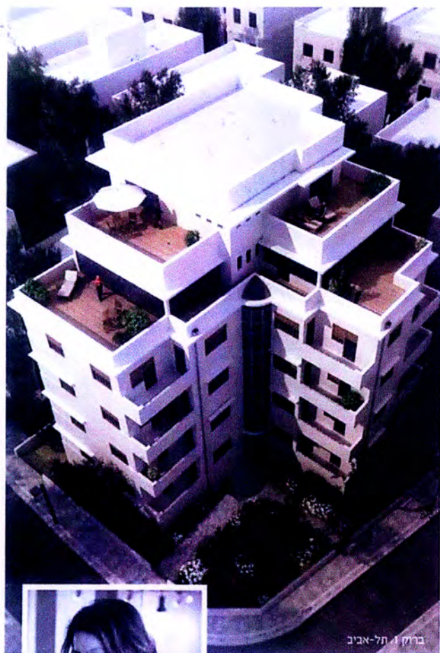
ברוך | תל-אביב